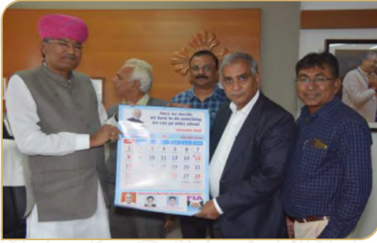
માન. શ્રી રાઘવજીભાઈ હંસરાજભાઈ પટેલ, કેબિનેટ મંત્રીશ્રી (કૃષિ)