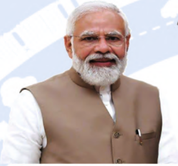
Shri. Narendrabhai Modi Hon'ble Prime Minister