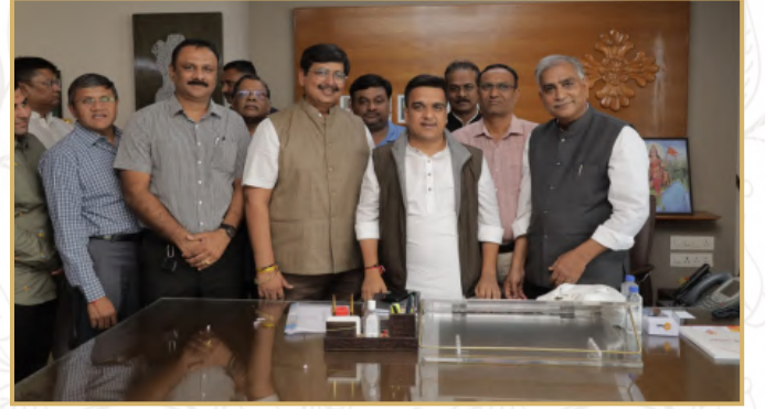
પ્રસ્તુત તસ્વીરમાં માન. શ્રી હર્ષભાઈ સંઘવી, માન. ગૃહ મંત્રીશ્રી (રાજ્ય કક્ષા) ને નિહાળી શકીએ છીએ.