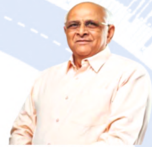
Shri. Bhupendrabhai Patel Hon'ble Chief Minister, Gujarat